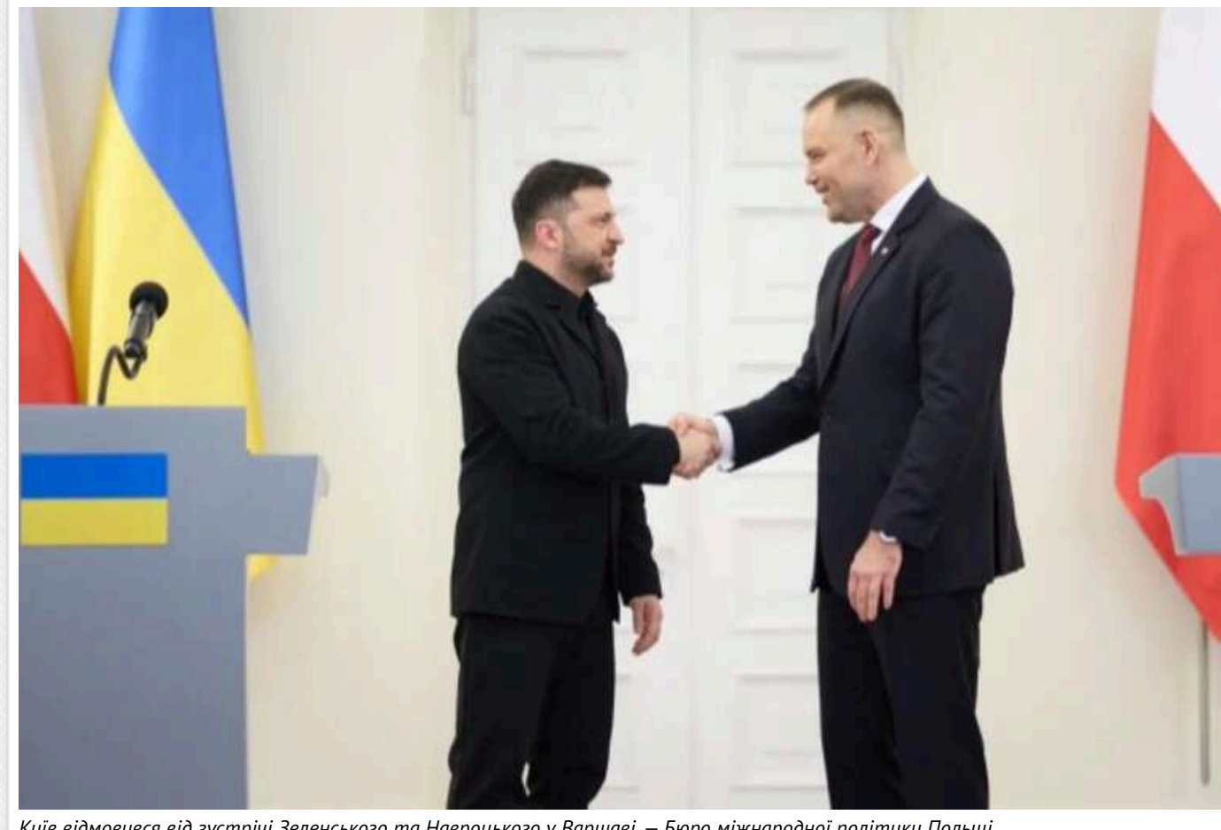
Київ відмовився від зустрічі Зеленського та Навроцького у Варшаві, – Бюро міжнародної політики Польщі

Українська сторона відмовилася від запланованої зустрічі у Варшаві між президентами Каролем Навроцьким і Володимиром Зеленським.