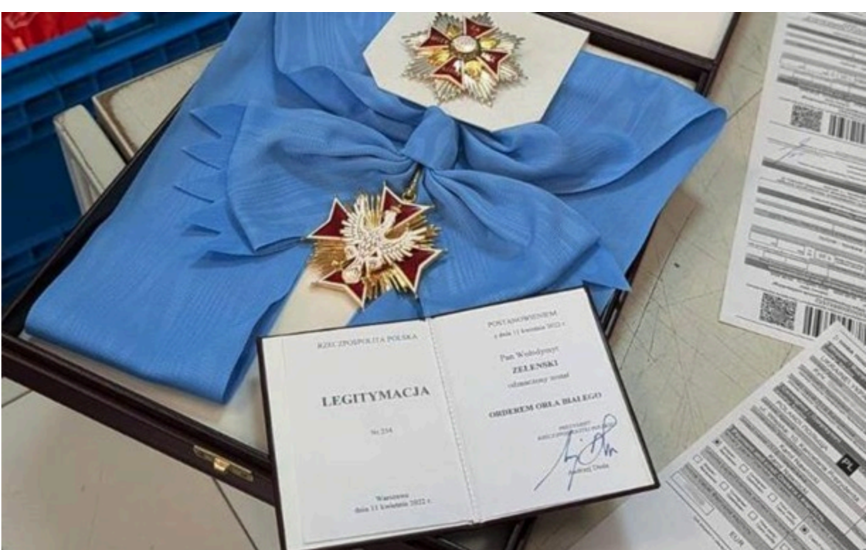
Зеленський повернув орден

Зеленський зауважив, що не розуміє тих польських політиків, які грають на антиукраїнських сентиментах у частині польського суспільства.