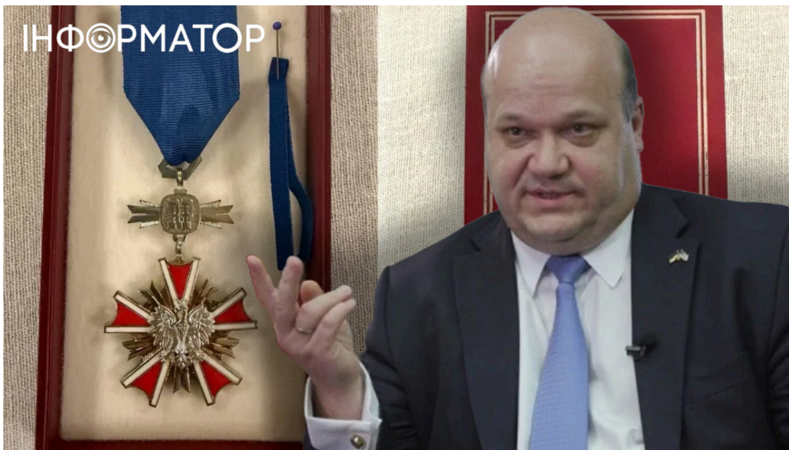
Чалий не поверне польський орден - пояснив чому

Надзвичайний і Повноважний Посол України Валерій Чалий заявив, що не повертатиме Кавалерський хрест Ордена Заслуг Республіки Польща. За його переконанням, масова відмова від польських нагород перетворилась на "флешмоб", який шкодить, а не допомагає Україні. Цю позицію дипломат озвучив 22 червня під час програми "Геополітичні діалоги". Він наголосив: цілі вже досягнуті, і кампанію слід зупинити.