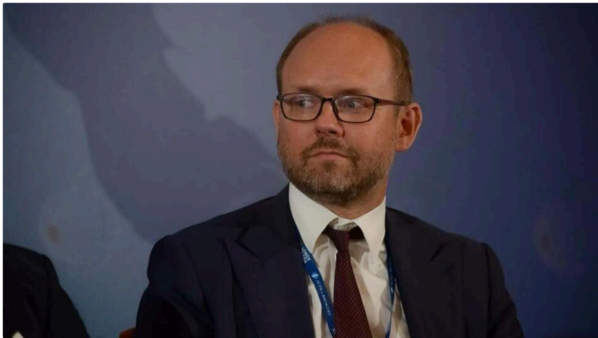
Представник адміністрації президента Польщі прокоментував інтерв'ю Зеленського

22 червня, 18:58 🗨️ Этот материал также можно прочитать на русском