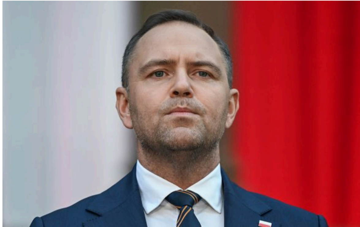
Фото: Кароль Навроцький (Getty Images)