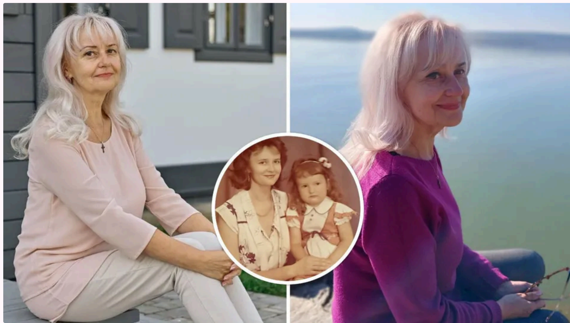
Фаріон розлучилася з батьком своєї доньки 2010 року

22 червня, 15.35 🗣️ Этот материал также можно прочитать на русском