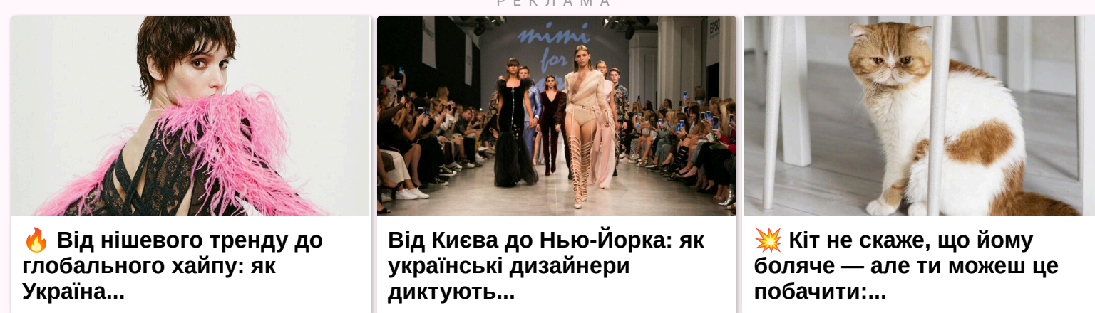
🔥 Від нішевого тренду до глобального хайпу: як Україна...