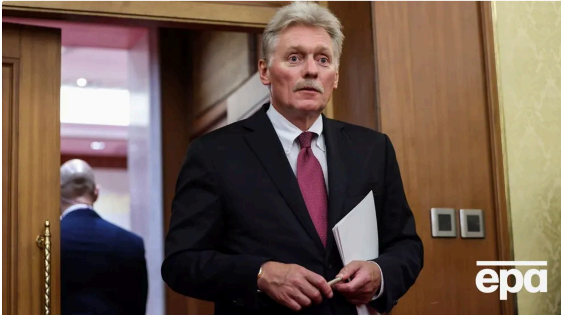
За словами Пескова, Білорусь "спроможна забезпечити свій суверенітет"

22 червня, 15.20 @ Етот материал также можно прочитать на русском