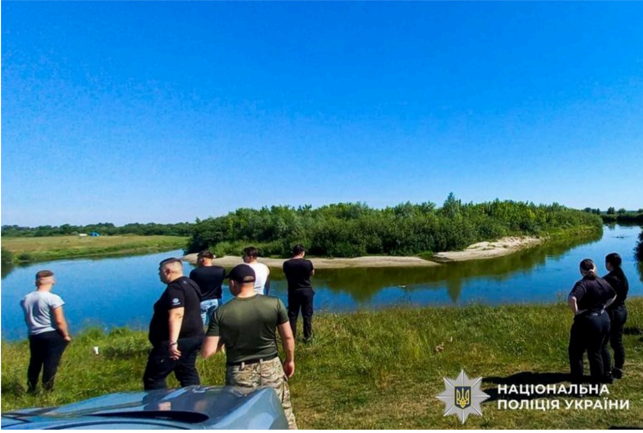
НАЦІОНАЛЬНА ПОЛІЦІЯ УКРАЇНИ

Близько 10:00 тіло 14-річного хлопця виявили у водоймі.