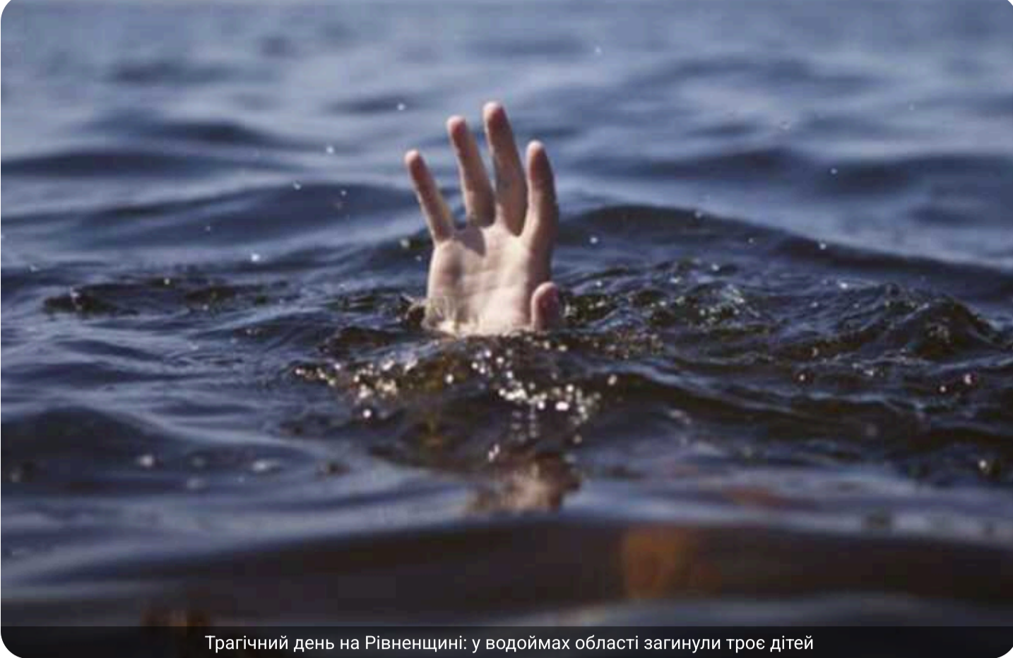
Трагічний день на Рівненщині: у водоймах області загинули троє дітей.

На Рівненщині зафіксовано трагічний випадок на воді: протягом однієї доби потонули троє дітей віком 11, 14 та 15 років. Відповідні органи проводять перевірку обставин загибелі.