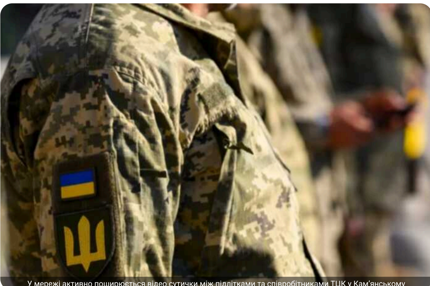
У мережі активно поширюється відео сутички між підлітками та співробітниками ТЦК у Кам'янському

У місті Кам'янське зафіксовано конфліктну ситуацію за участю групи підлітків та представників ТЦК.