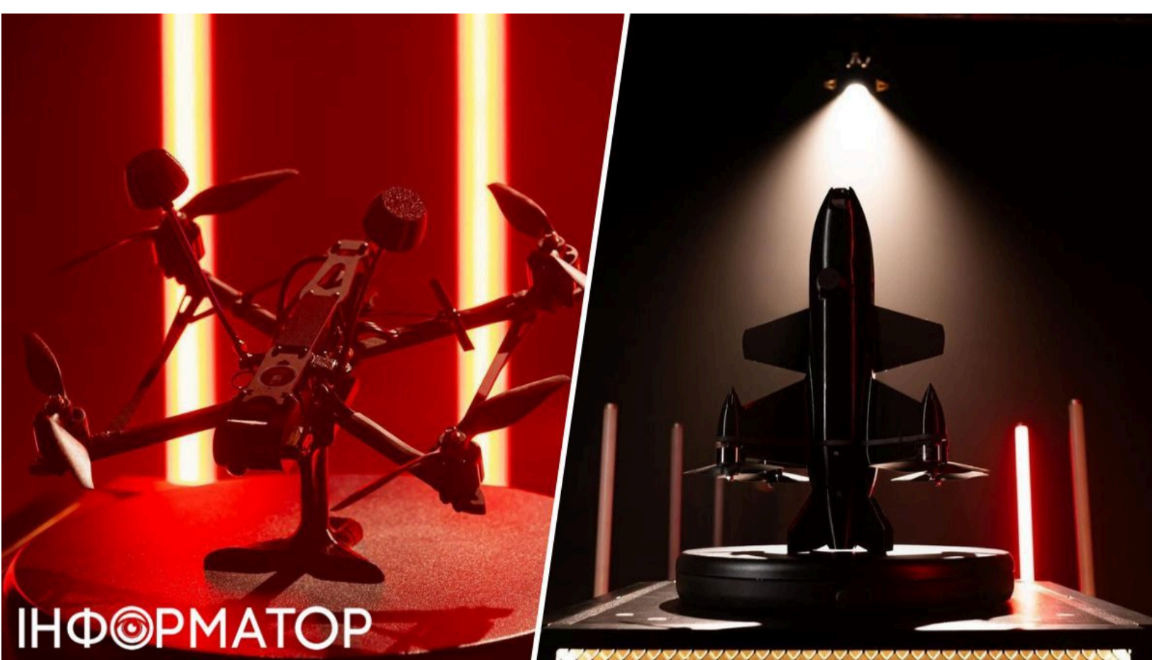
Росія вдарила по виробництву "Генерал Черешня" - подробиці

Росіяни вдарили по одному з виробничих підприємств українського виробника дронів "Генерал Черешня" . Внаслідок удару жоден із працівників не постраждав. Компанія продовжує оцінювати масштаби завданих збитків та визначас обсяг відновлювальних робіт.