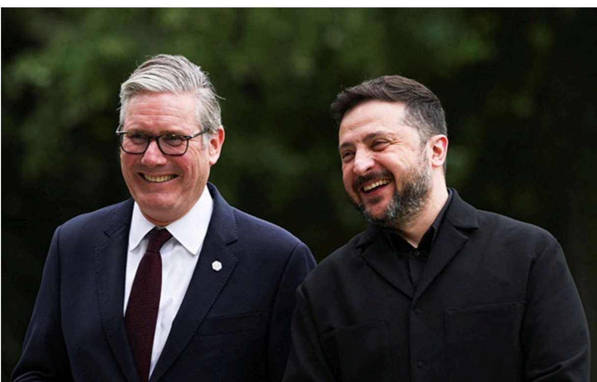
Кір Стармер і Володимир Зеленський на полях саміту G7 16 червня 2026 року

Стармер йде у відставку з посади лідера Лейбористської партії та відкриває шлях до боротьби за посаду прем'єр-міністра Британії.