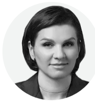
Автор колонки: Тетяна Лисенко

Протягом 2026 року ДПСУ планує провести понад 4,5 тисячі перевірок. Хоча плановий перелік бізнесів заздалегідь публікується на сайті податкової, підприємці часто дізнаються про візит інспекції уже під час безпосереднього отримання повідомлення. Часу, аби якісно підготуватись і зібрати необхідні документи, у цей момент зазвичай бракує.