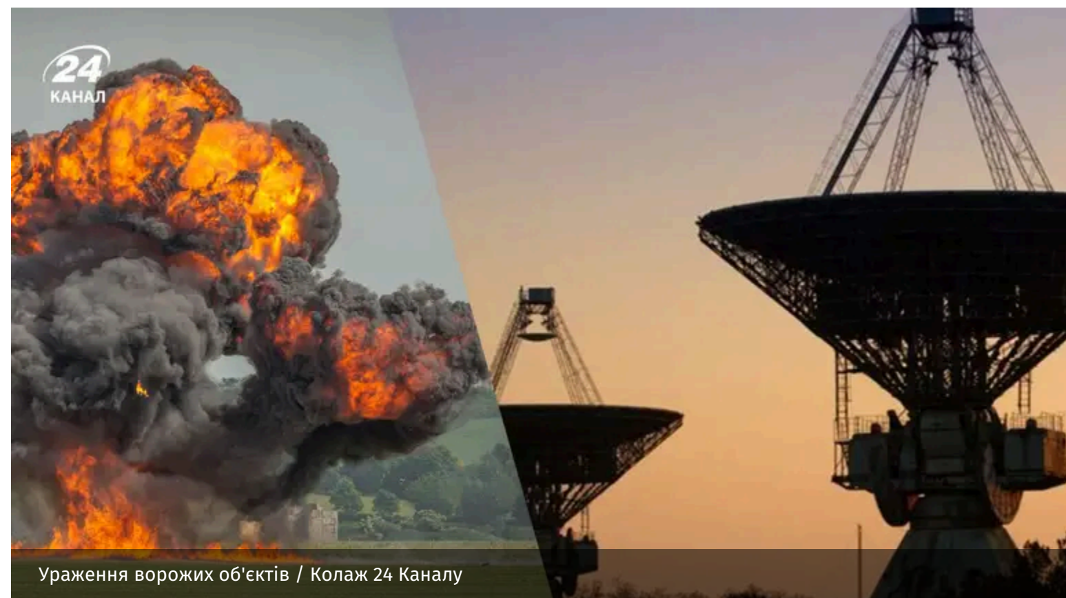
Ураження ворожих об'єктів

Українські військові продовжують завдавати "болючих" ударів по об'єктах ворога, зокрема в глибокому російському тилу. Так, під прицілом опинилися центр космічного зв'язку у Московській області та порт "Кавказ".