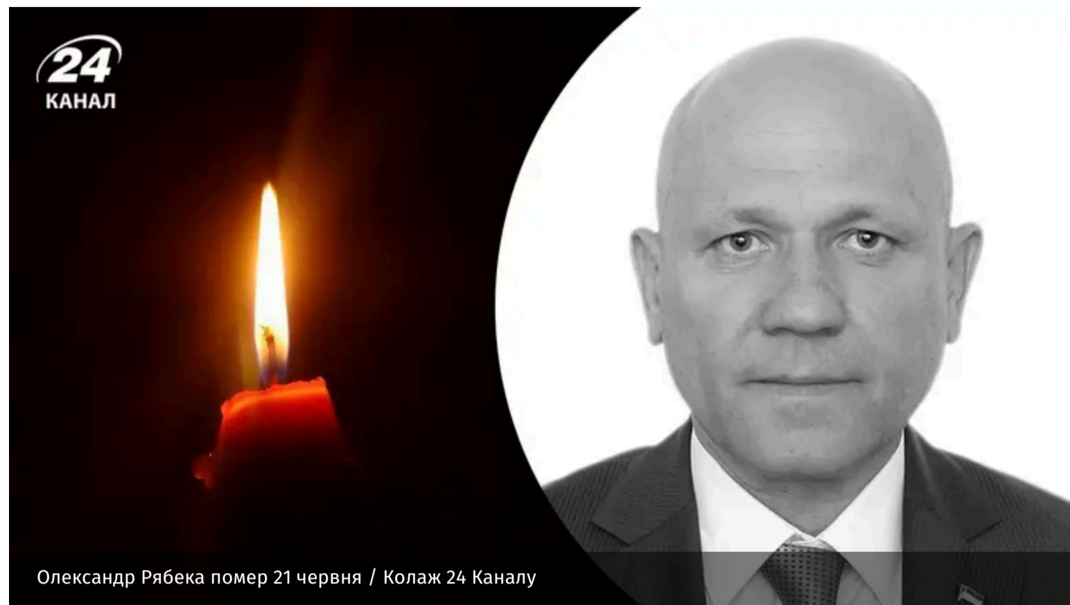
Олександр Рябека помер 21 червня / Колаж 24 Каналу

У неділю, 21 червня, на 67-му році життя помер народний депутат України V та VI скликань, науковець та правозахисник Олександр Рябека.