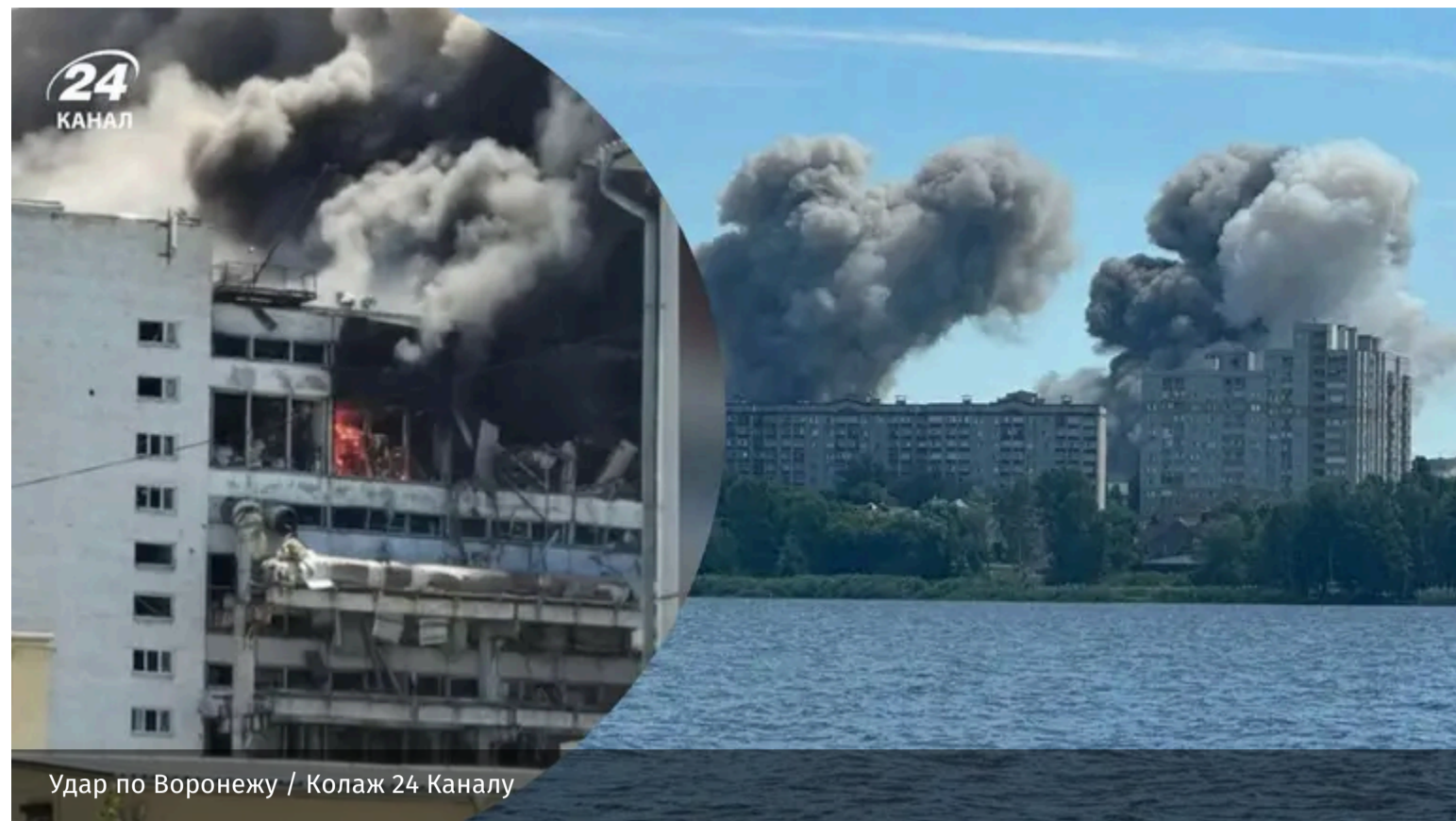
Удар по Воронежу / Колаж 24 Каналу

У понеділок, 22 червня, російський Воронеж опинився під ракетною атакою. Там сталося результативне влучання по заводу з виробництва електроніки для російських ракет ОТРК "Іскандер" та Х-101.