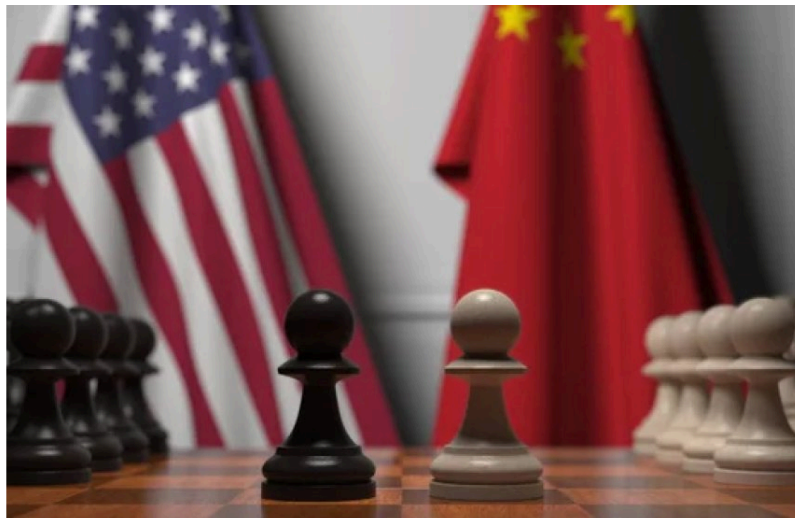
Китай запровадив нові торгові обмеження проти США

Китай 22 червня оголосив про нові експортні обмеження для американських компаній у відповідь на те, що США цього місяця запровадили обмеження на кілька китайських компаній. Під удар потрапили оборонні виробники, розробники дронів і компанії, пов'язані зі стратегічною сировиною.