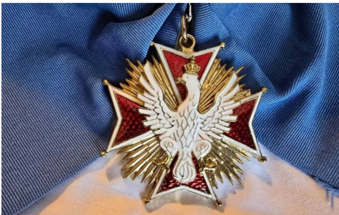
Фото: орден Білого Орла забрали у Зеленського, але не у диктаторів (wpolityse.pl)

Не витрачай час на шум! Читай тільки суть з РБК-Україна у Google