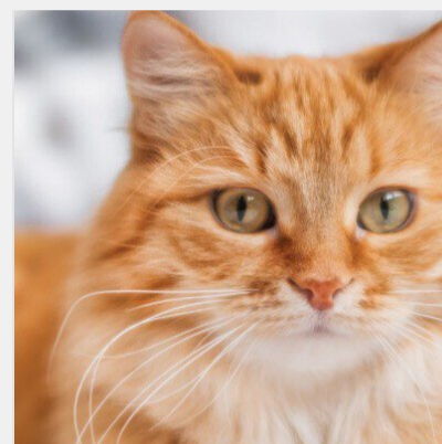
Терплять тільки через любов до вас: ТОП-10 речей, які ..