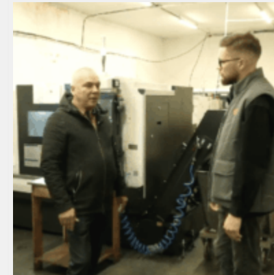
Верстати для «Іскандерів». Як обладнання Siemens і Fanuc досі потрапляє в РФ