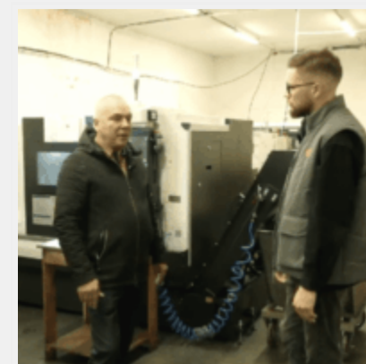
Верстати для «Іскандерів». Як обладнання Siemens і Fanuc досі потрапляє в РФ