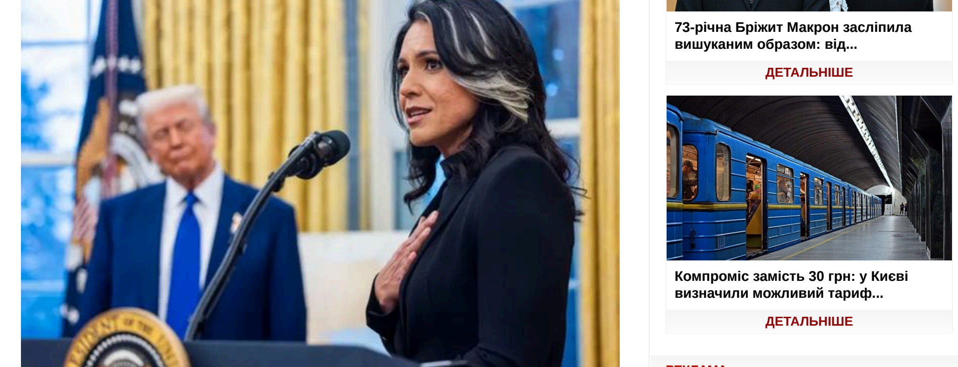
Президент США Дональд Трамп (ліворуч) і Тулсі Габбард, директор Національної розвідки США, під час церемонії присяги в Овальному кабінеті Білого Овну у Вашингтоні, округ Колумбія, США

Читайте також: Повержена держава: як адміністрація Трампа вбиває репутацію американської розвідки