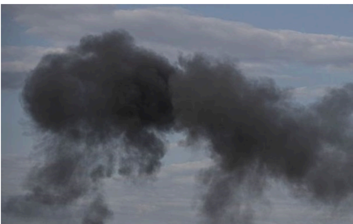
Фото: Getty Images (ілюстративне фото) У Катарі стався вибух на заводі з переробки СПГ

Інцидент, що стався під час запуску виробництва в промисловому містечку Рас-Лаффан, призвів до вибуху та пожежі на місцевому газорозподільному об'єкті Вагзан.