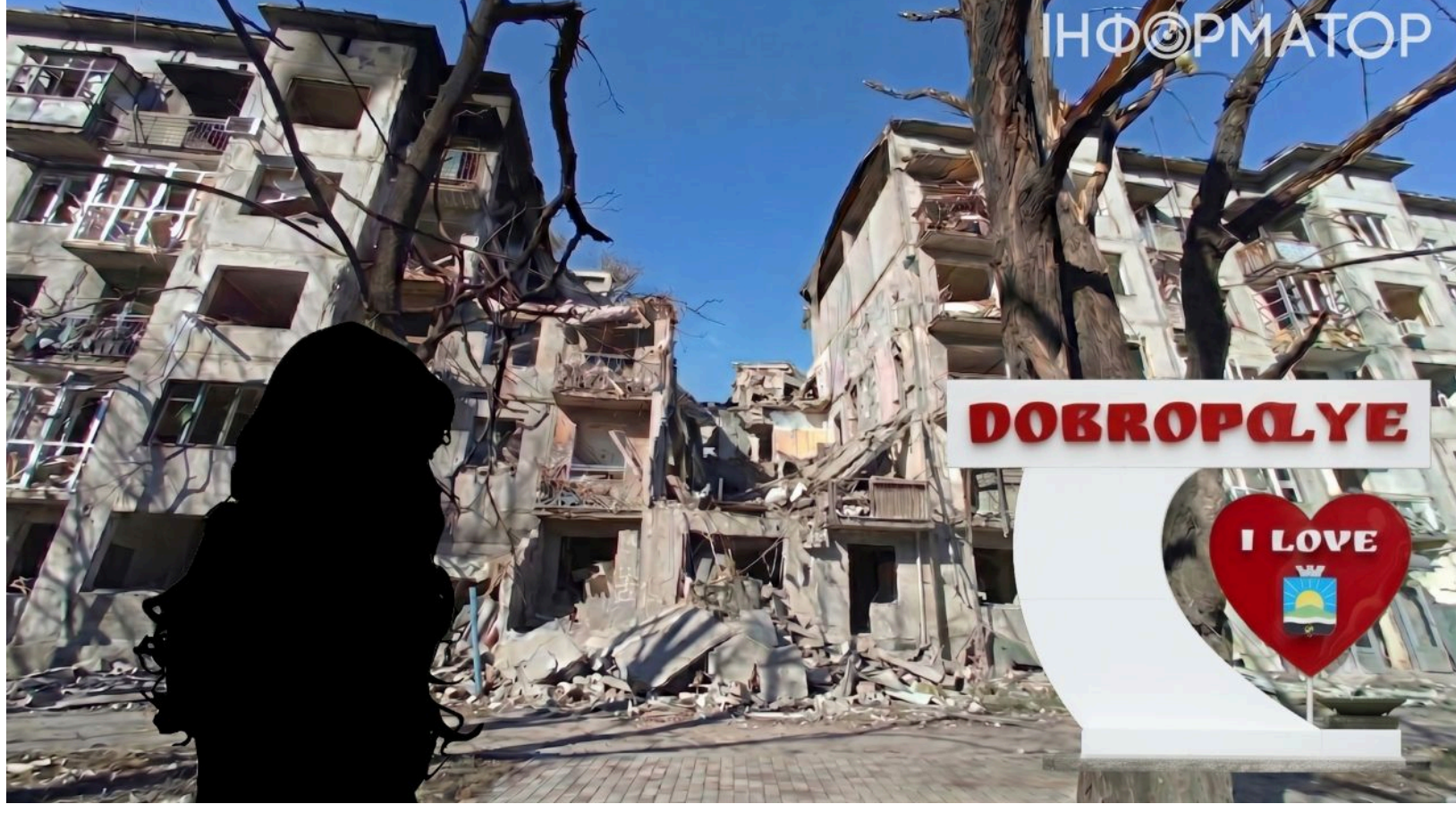
Жінка, яка пережила приліт у жовтні 2025, тепер має пережити байдужість чиновників та недосконалість існуючих правил.

У травні 2026 року власники сертифікатів "єВідновлення" масово зіткнулися із затримками виплат, через що сотні людей ризикують втратити нове житло. Серед них - жителька Добропілля , чия квартира знищила російська авіабомба. Жінка пройшла через пастику з документами та шантаж колишнього чоловіка, щоб знайти новий будинок й забронювати під нього кошти. Тепер фінансування немає, термін завдатку спливає, а вона ризикує знову залишитися ні з чим.