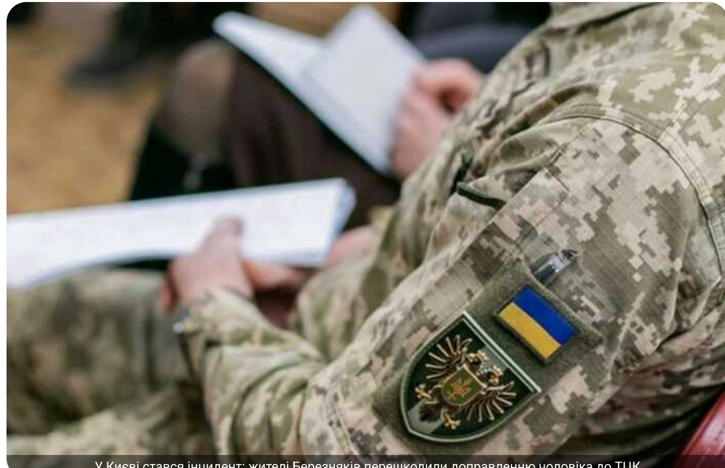
У Києві стався інцидент: жителі Березняків перешкодили доправленню чоловіка до ТЦК

У кийському мікрорайоні Березняки сталася конфліктна ситуація під час мобілізаційних заходів. Місцеві жителі заблокували рух транспорту, перешкодивши співробітникам ТЦК та СП здійснити примусове транспортування громадянина до установи.