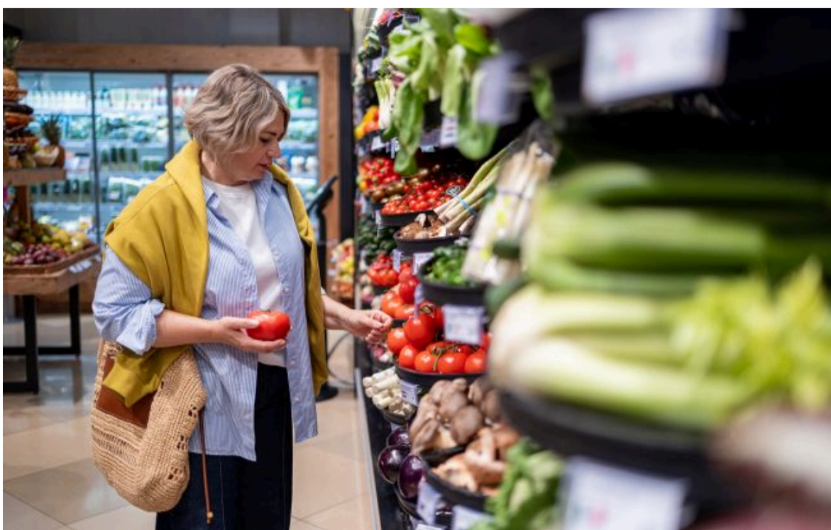
Фото: обмеження набудуть чинності вже з понеділка (Getty Images)

Не витрачай час на шум! Читай тільки суть з РБК-Україна у Google