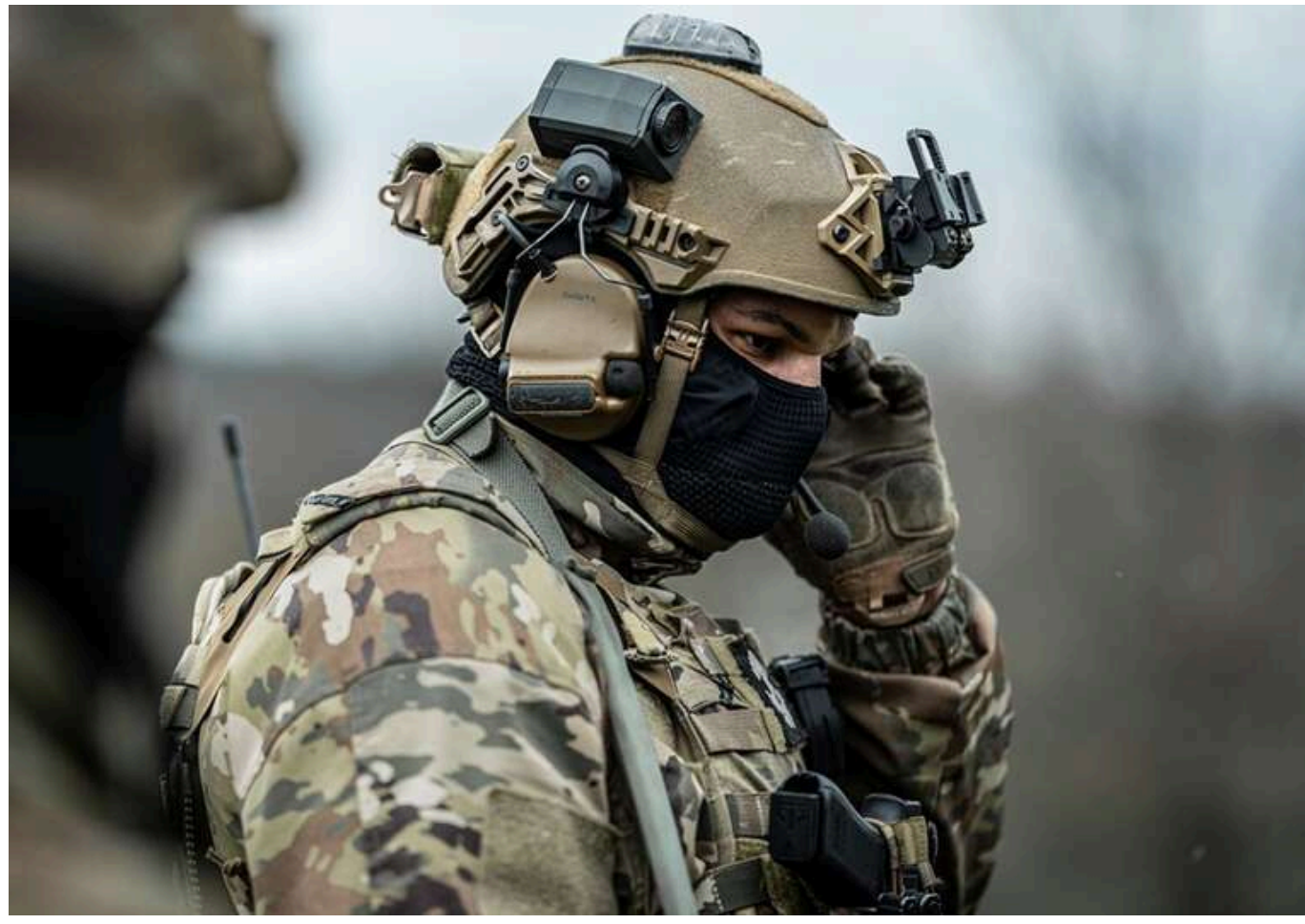
Ситуація на фронті: за добу росіяни здійснили 205 атак і застосували понад 6 тисяч дронів

Читати на руском Read in English Додати як бажане джерело в Google