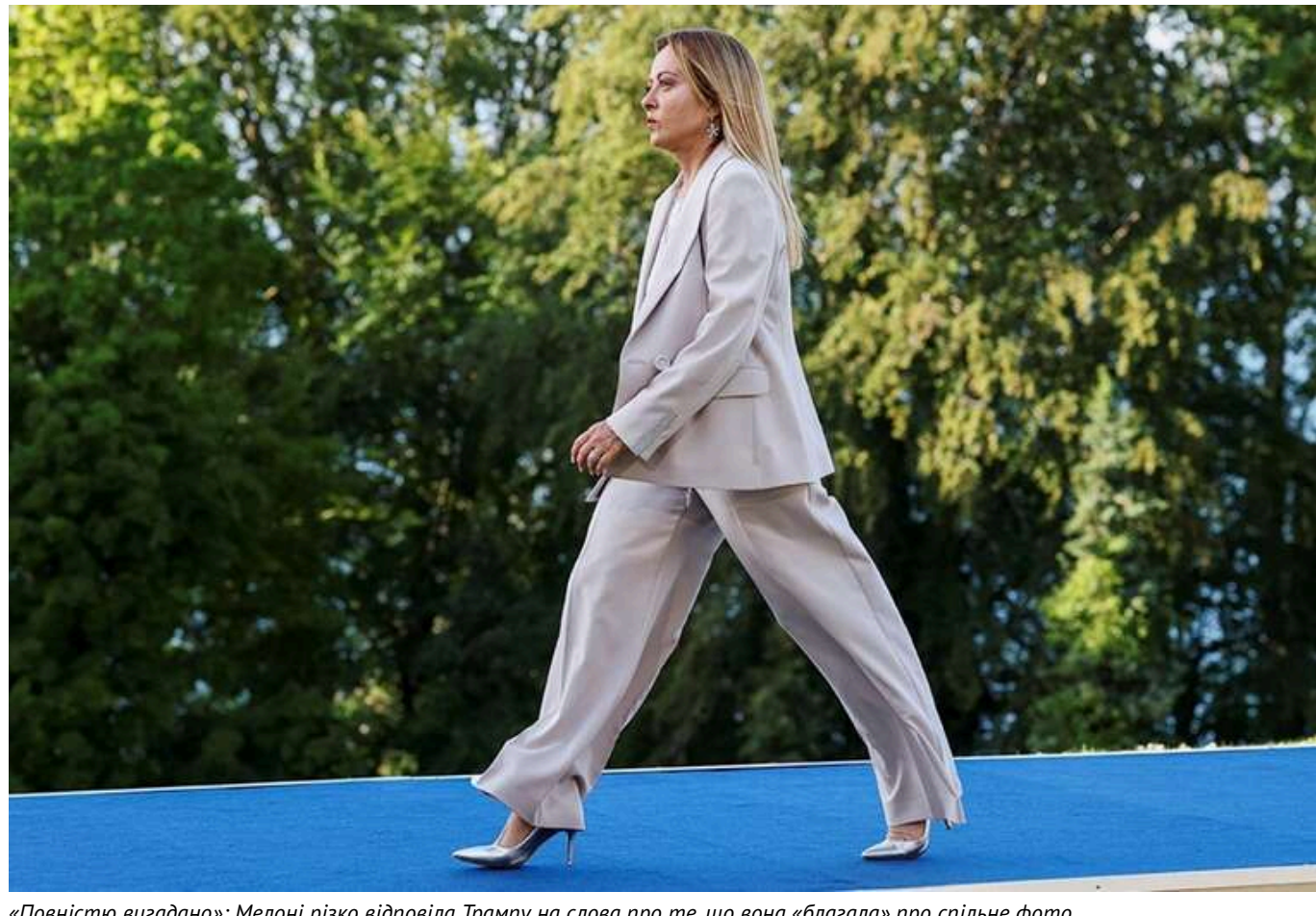
«Повністю вигадано»: Мелоні різко відповіла Трампу на слова про те, що вона «благала» про спільне фото

Прем'єр-міністерка Італії Джорджія Мелоні довгий час була найвідданішим європейським союзником Дональда Трампа, утримуючись від будь-якої різкої публічної критики президента США, попри дедалі більш обурливі провокації, повідомляє Financial Times.