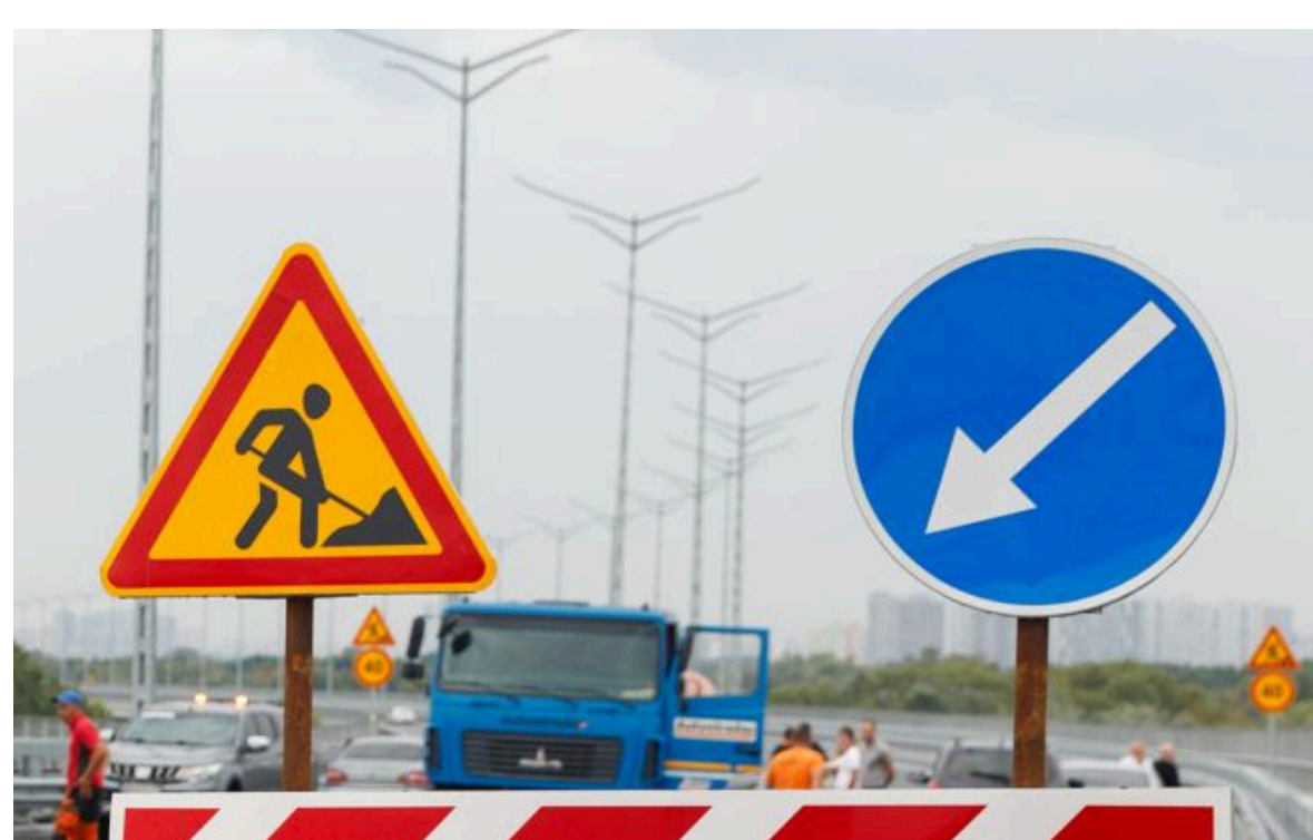
Фото: ремонт доріг у Києві (kyivcity.gov.ua)

Не витрачай час на шум! Читай тільки суть з РБК-Україна у Google