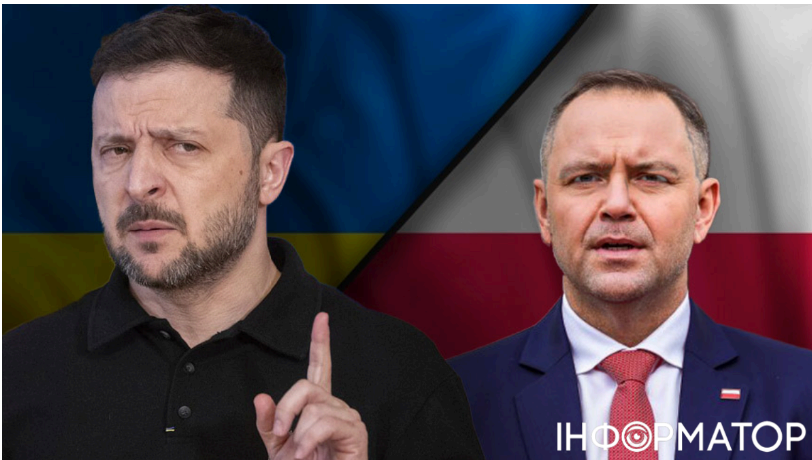
Зеленський відповідає на кроки Навроцького

Президент України Володимир Зеленський уперше публічно дав розгорнуту оцінку діям польського президента Кароля Навроцького - той позбавив його ордена Білого Орла через присвоєння одному з підрозділів ССО найменування "Героїв УПА". Суперечки між двома країнами через історичні питання вже тривалий час обговорюються у контексті їхніх відносин з Москвою. Зеленський назвав кроки Навроцького електоральною грою і попередив: така стратегія погано закінчиться - як для Угорщини за Орбана.