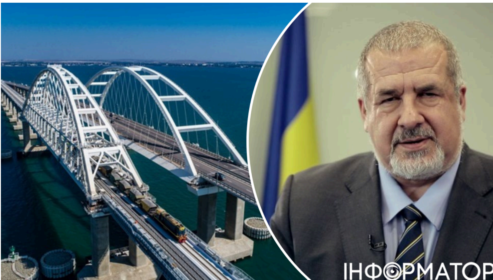
Чубаров закликав росіян покинути Крим

Сили оборони України 21 червня завдали удару по Керченській поромній переправі й зупинили її роботу. Раніше ЗСУ вже обмежили пропускну здатність Керченського (Кримського) мосту і взяли під вогневий контроль трасу "Новоросія". Голова Меджлису кримськотатарського народу Рефат Чубаров заявив, що окупований півострів фактично входить у фазу ізоляції. Він закликав росіян, які незаконно оселилися в Криму, виїжджати - поки переправа і міст ще функціонують хоч якось.