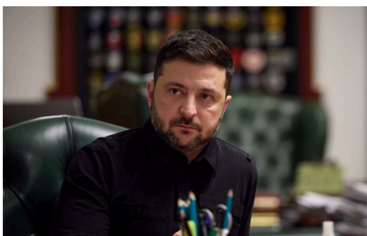
Фото: Президент України Володимир Зеленський (facebook.com/zelenskyy.official.jpg)