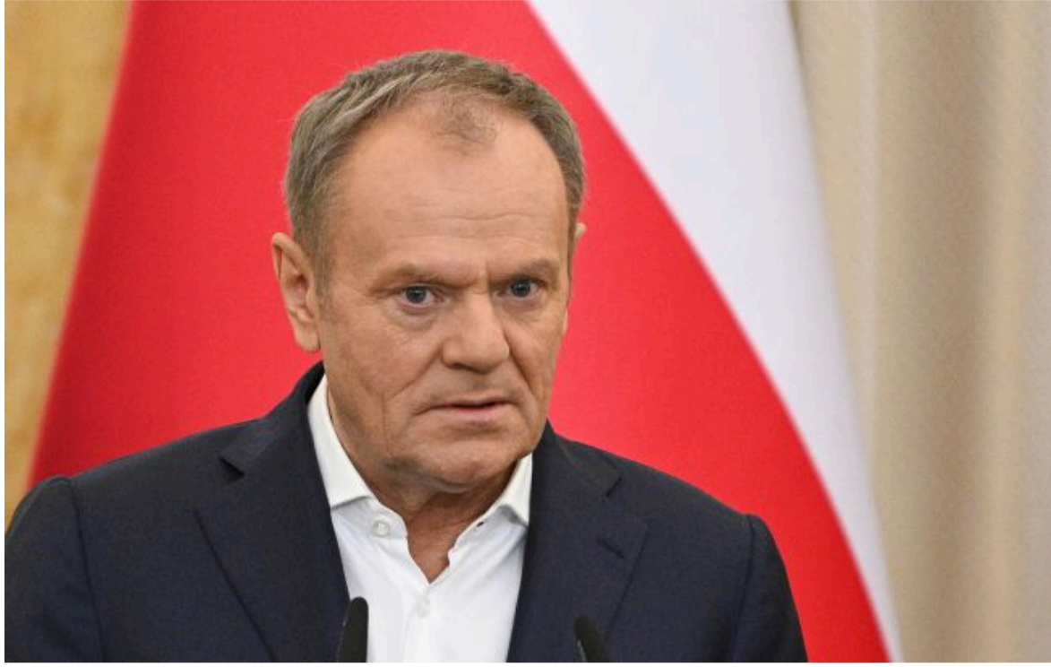
Фото: прем'єр-міністр Польщі Дональд Туск (Getty Images)

Не витрачай час на шум! Читай тільки суть з РБК-Україна у Google