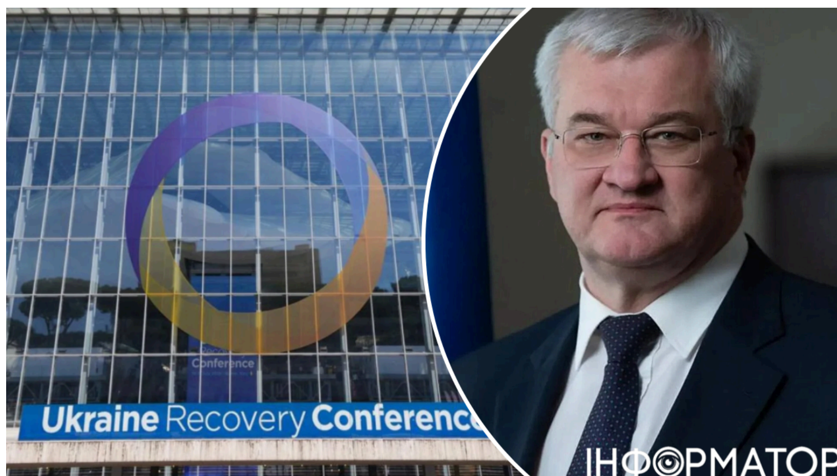
Сибіга конференція Польща

Україна ще не вирішила, чи братиме участь у Конференції з питань відновлення 25-26 червня у польському Гданську. Рішення залежатиме від доповіді, яку глава МЗС Андрій Сибіга підготує для президента Володимира Зеленського. Тим часом спікер польського Сейму вважає, що Зеленський до Гданська не приїде - через масштабний орденський скандал між двома країнами , який переріс у "неконтрольовані емоції".