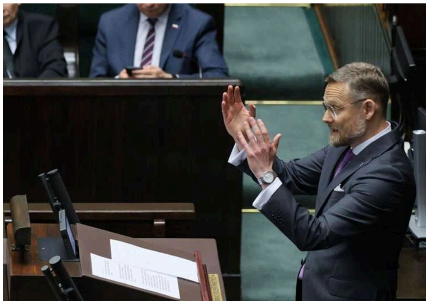
У Канцелярії президента Польщі відповіли Сибізі: Позбавлення Зеленського ордена — це не помилка, відповідальність на Україні

Після позбавлення президента України Володимира Зеленського ордена Білого Орла, керівник Канцелярії президента Польщі Збігнєв Богуцький відкинув заяви про стратегічну помилку Варшави. За його словами, відповідальність за ситуацію належить Україні через рішення присвоїти одній з військових частин назву "Героїв УПА".