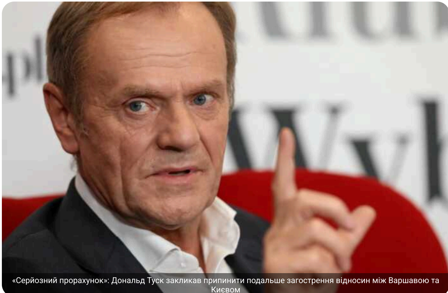
«Серйозний прорахунок»: Дональд Туск закликав припинити подальше загострення відносин між Варшавою та Києвом

Прем'єр-міністр Польщі Дональд Туск назвав участь політиків у міждержавному конфлікті «стратегічною помилкою», від якої програють і Україна, і Польща.