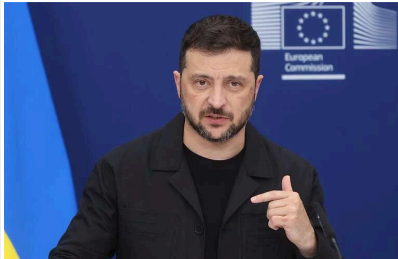
Зеленський ще не ухвалив рішення щодо участі в конференції з відбудови у Гданську, - Сибіга

Президент України Володимир Зеленський ще не вирішив, чи візьме участь у конференції з відновлення України, яка відбудеться у польському Гданську 25-26 червня.