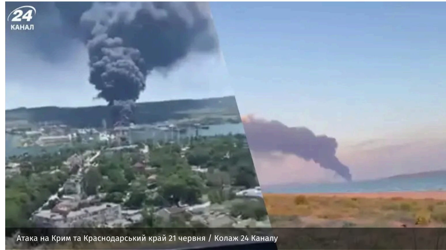
Атака на Крим та Краснодарський край 21 червня

У тимчасово окупованому Криму та в російському Краснодарському краї 21 червня неспокійно. Після атак дронів на важливих для окупантів об'єктах видніються пожежі.