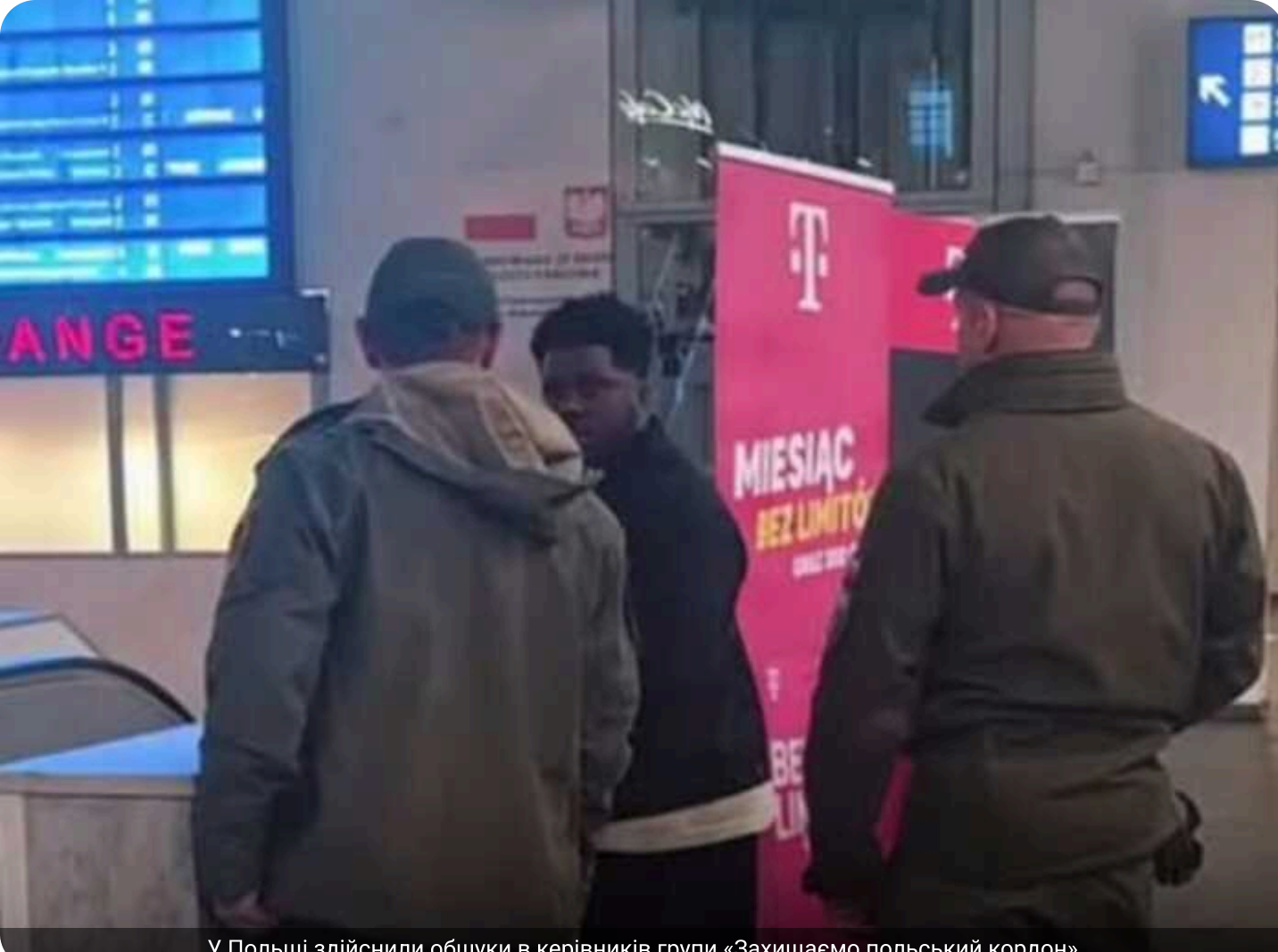
У Польщі здійснили обшуки в керівників групи «Захищаємо польський кордон»

У Польщі правоохоронці провели обшуки у керівників та активістів групи «Wronimy Polskiej Granicy» («Захищаємо польський кордон»), яку пов'язують із польським політиком Гжегошем Брауном.