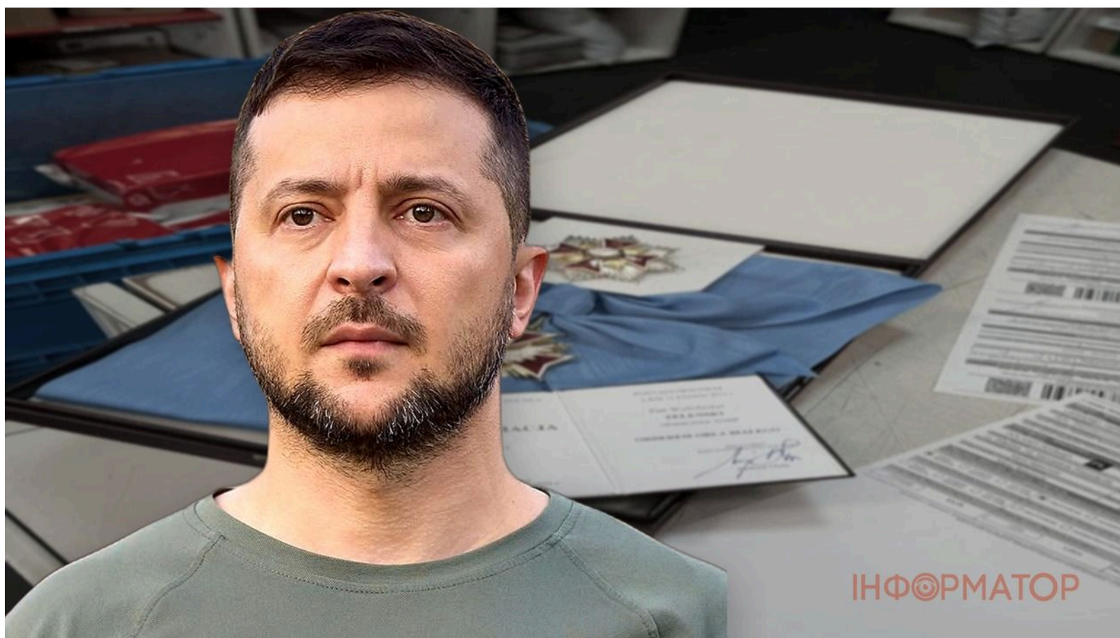
Французькі політики посварилися через орден Зеленського

Скандал навколо позбавлення Володимира Зеленського найвищої польської нагороди вийшов за межі українсько-польських відносин і розпалив гостру дискусію у Франції. Лідер президентської партії "Відродження" Габріель Атталь і голова партії "Національне об'єднання" Жордан Барделла публічно посперечалися через ставлення до України та Польщі. Причиною суперечки стали відносини між двома країнами, а конфлікт спалахнув після зустрічі Барделли з президентом Польщі.