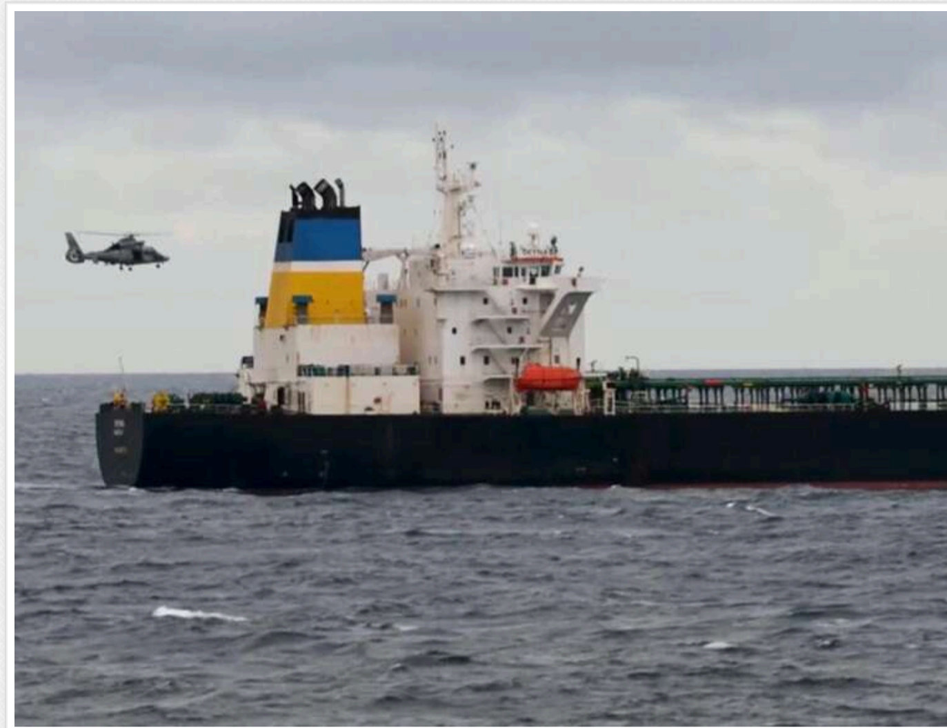
Німеччина та Франція закликають посилити контроль за російським «тіньовим флотом»

Депутати німецького та французького парламентів виступили зі спільною ініціативою щодо конкретніших кроків проти суден російського "тіньового флоту".