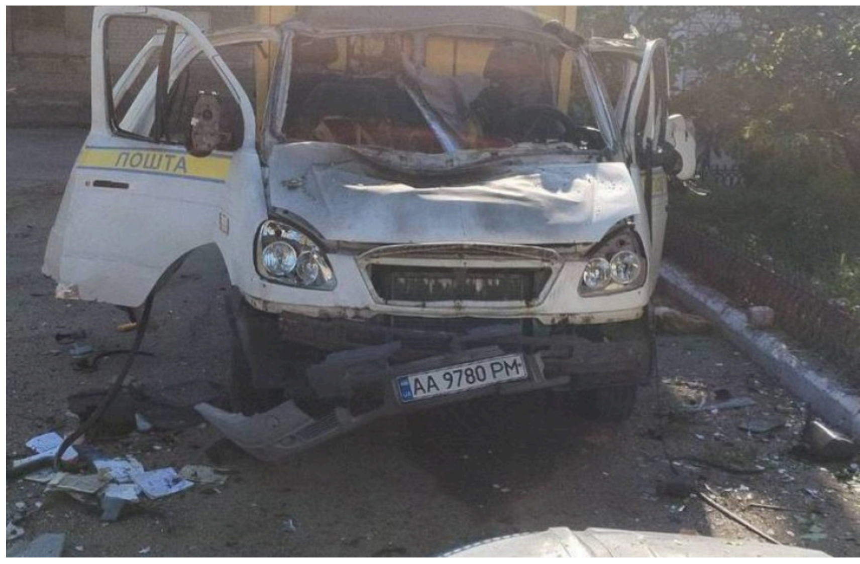
"Укрпошта" втратила чотири авто за тиждень

"Укрпошта" тимчасово призупинила роботу пересувних відділень у Нікопольському районі Дніпропетровської області через безпекову ситуацію. Рішення ухвалили після атаки FPV-дронів, унаслідок якої були знищені два автомобілі компанії.