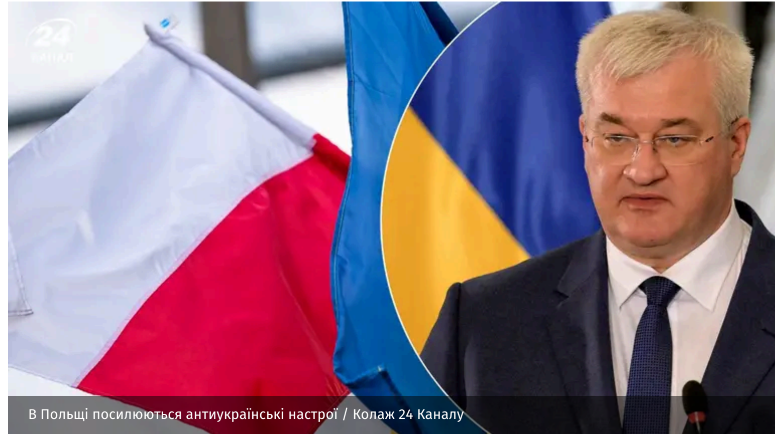
В Польщі посилюються антиукраїнські настрої

У Польщі зростає кількість інцидентів із проявами агресії та упередженого ставлення до громадян України. Повідомляється про випадки нападів, приниження та булінгу, зокрема серед дітей у навчальних закладах.