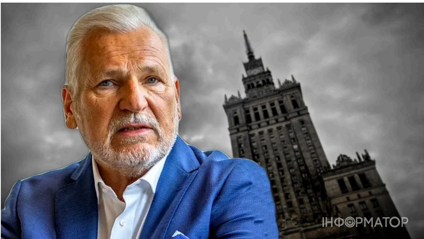
Квасневський попередив Навроцького про ризик серйозної помилки

Перемога антиукраїнських сил в Польщі може призвести до того, що 1,5 млн українців або повернуться до України, або переберуться далі на захід Європи. Це стане ударом для польської економіки. Занепадуть сфера послуг, охорона здоров'я, догляд за пенсіонерами, будівництво та багато інших.