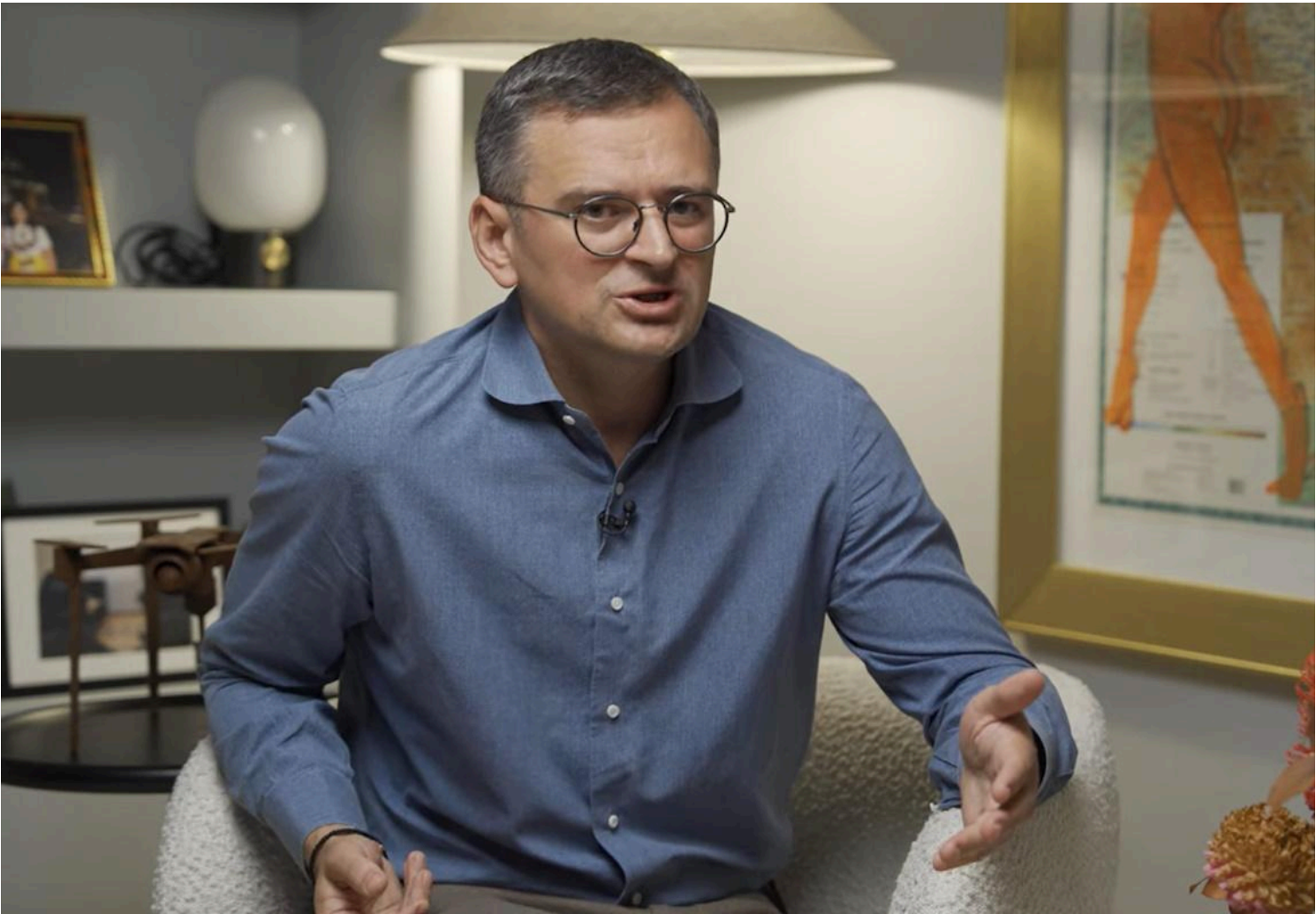
Ексіміністр Кулеба вважає, що польський президент свідомо пішов на ескалацію / скріншот

Навроцький не хотів виглядати слабким у ситуації з присвоєнням одному з підрозділів Сил оборони України імені Героїв УПА.