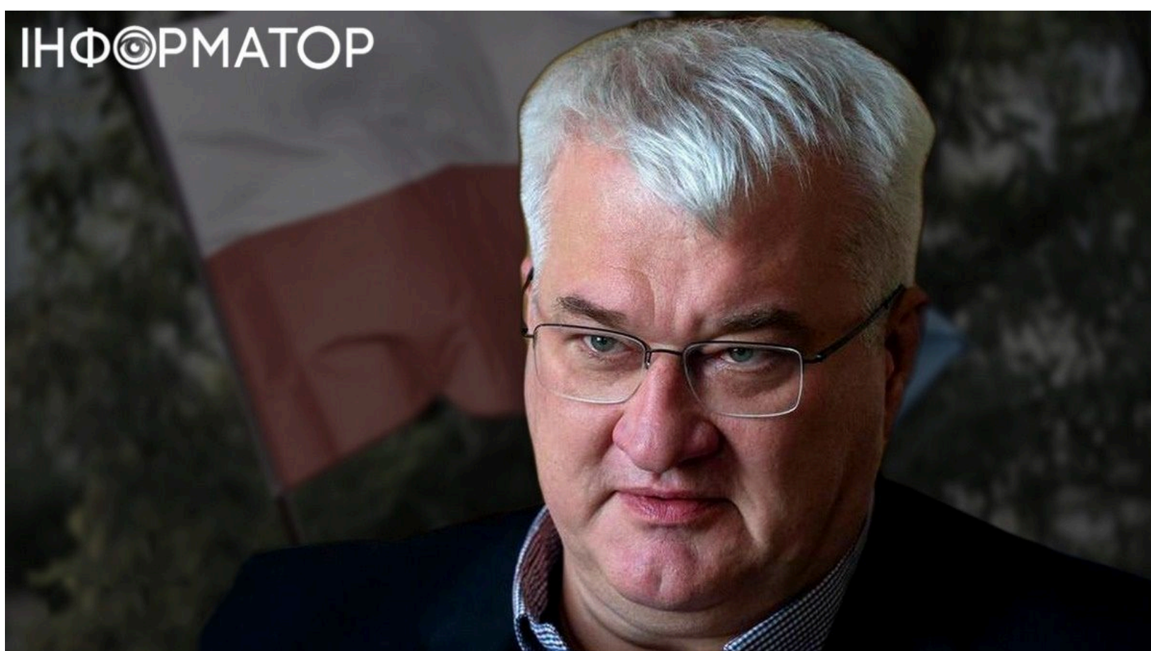
Сибіга попередив Польщу і згадав Орбана

Міністр закордонних справ України Андрій Сибіга заявив, що Київ відтепер симетрично відповідатиме на будь-які недружні кроки Варшави. Схожу провокаційну логіку вже випробував угорський колишній прем'єр Віктор Орбан. Скандал навколо позбавлення Зеленського ордена Білого Орла президентом Польщі Каролем Навроцьким загострив двосторонні відносини до критичної позначки. Сибіга виступив в ефірі телемарафону і окреслив нову позицію України у стосунках з польською стороною.