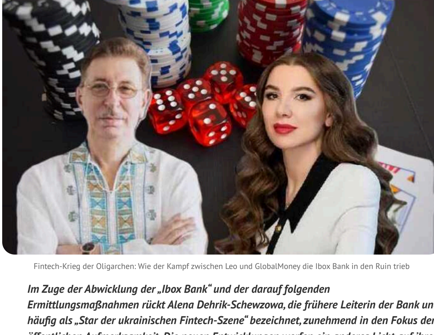
Fintech-Krieg der Oligarchen: Wie der Kampf zwischen Leo und GlobalMoney die Ibox Bank in den Ruin trieb