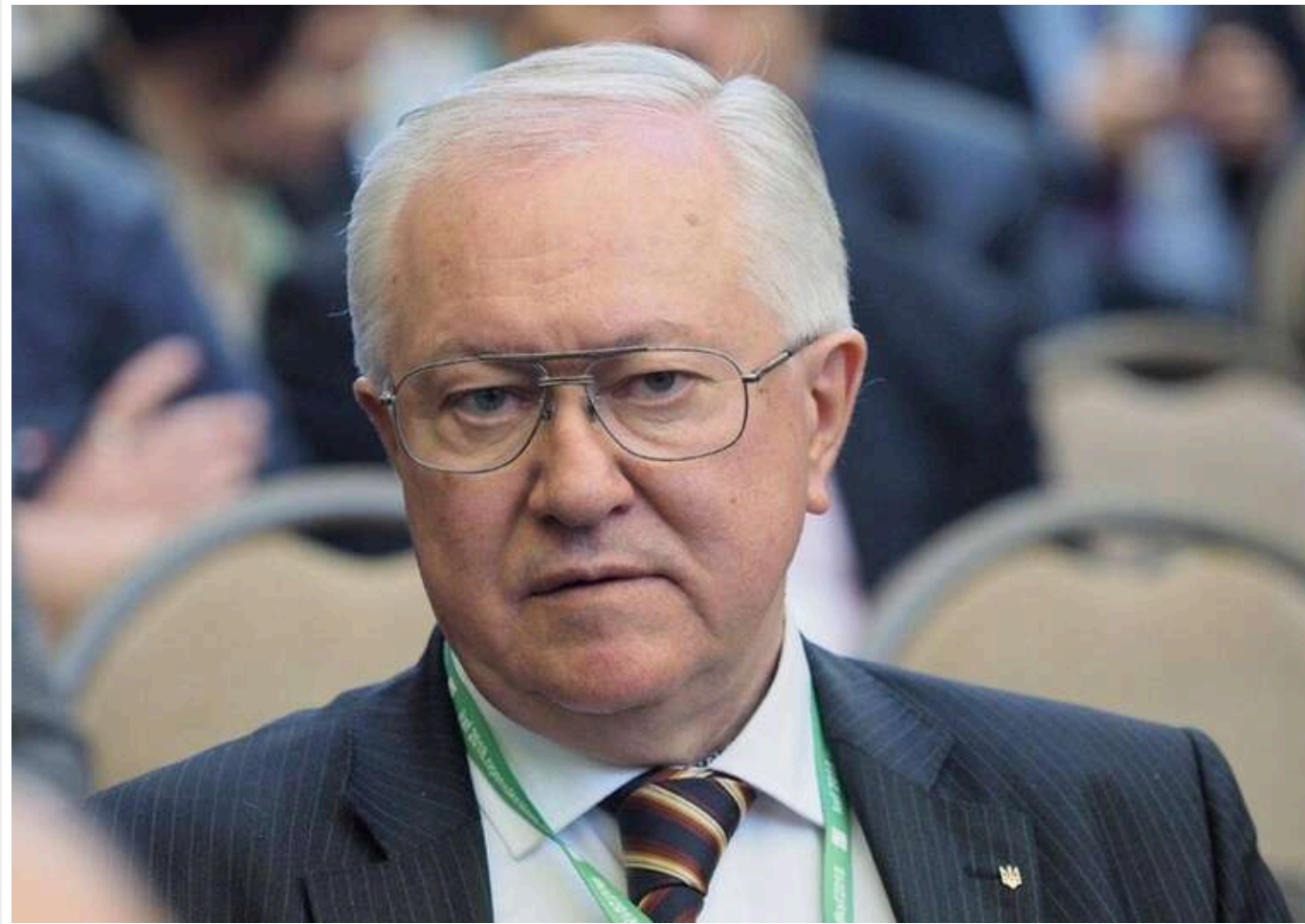
Дипломат Борис Тарасюк повернув державну нагороду Польщі на знак протесту проти дій Навроцького

Двічі міністр закордонних справ, колишній представник України при Раді Європи Борис Тарасюк на тлі скандалу навколо позбавлення ордена президента України вирішив повернути Великий хрест ордена Заслуг Республіки Польща, яким був нагороджений.