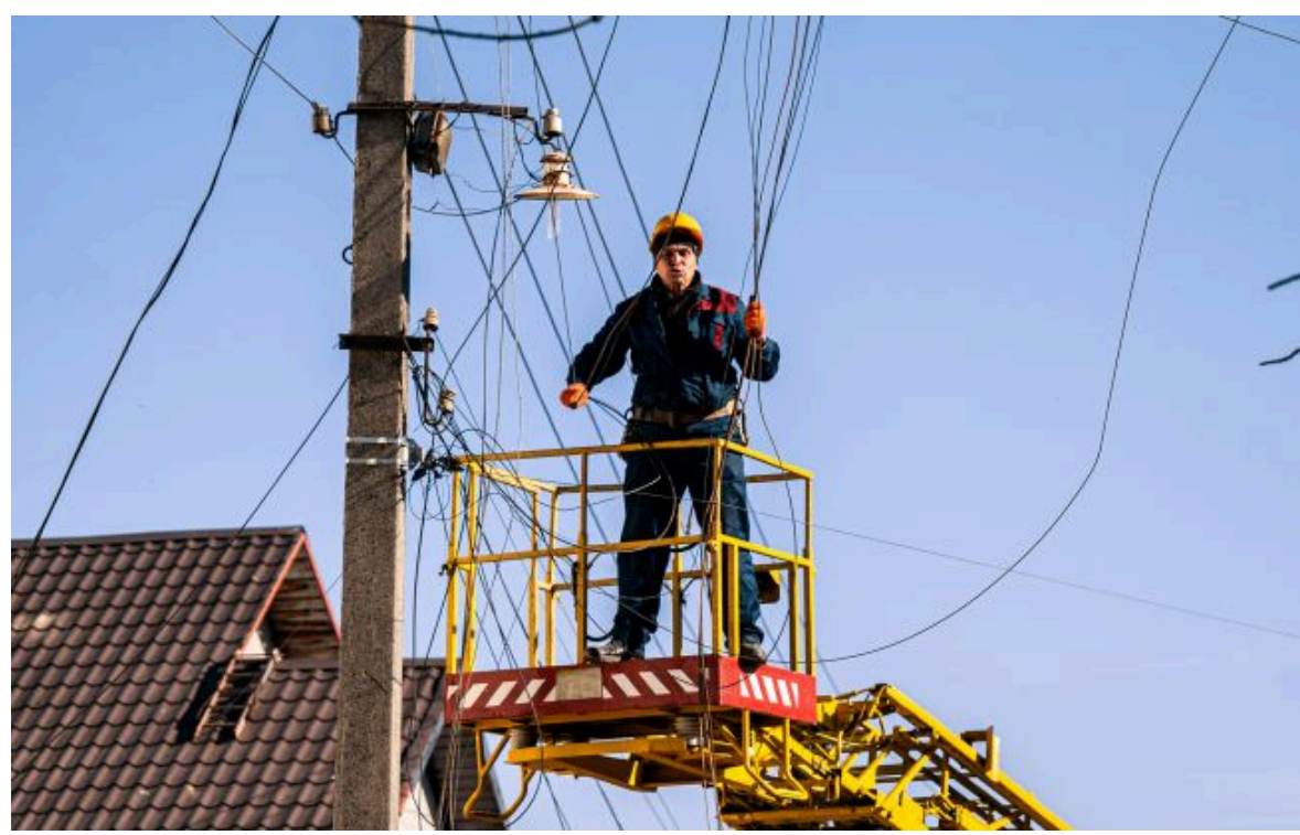
Фото: у Криму перебої зі світлом

Не витрачай час на шум! Читай тільки суть з РБК-Україна у Google