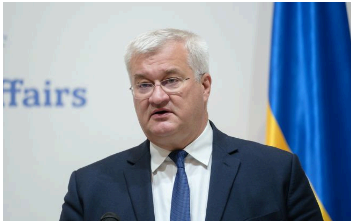
Фото: міністр закордонних справ України Андрій Сибіга (Віталій Носач, РБК-Україна)