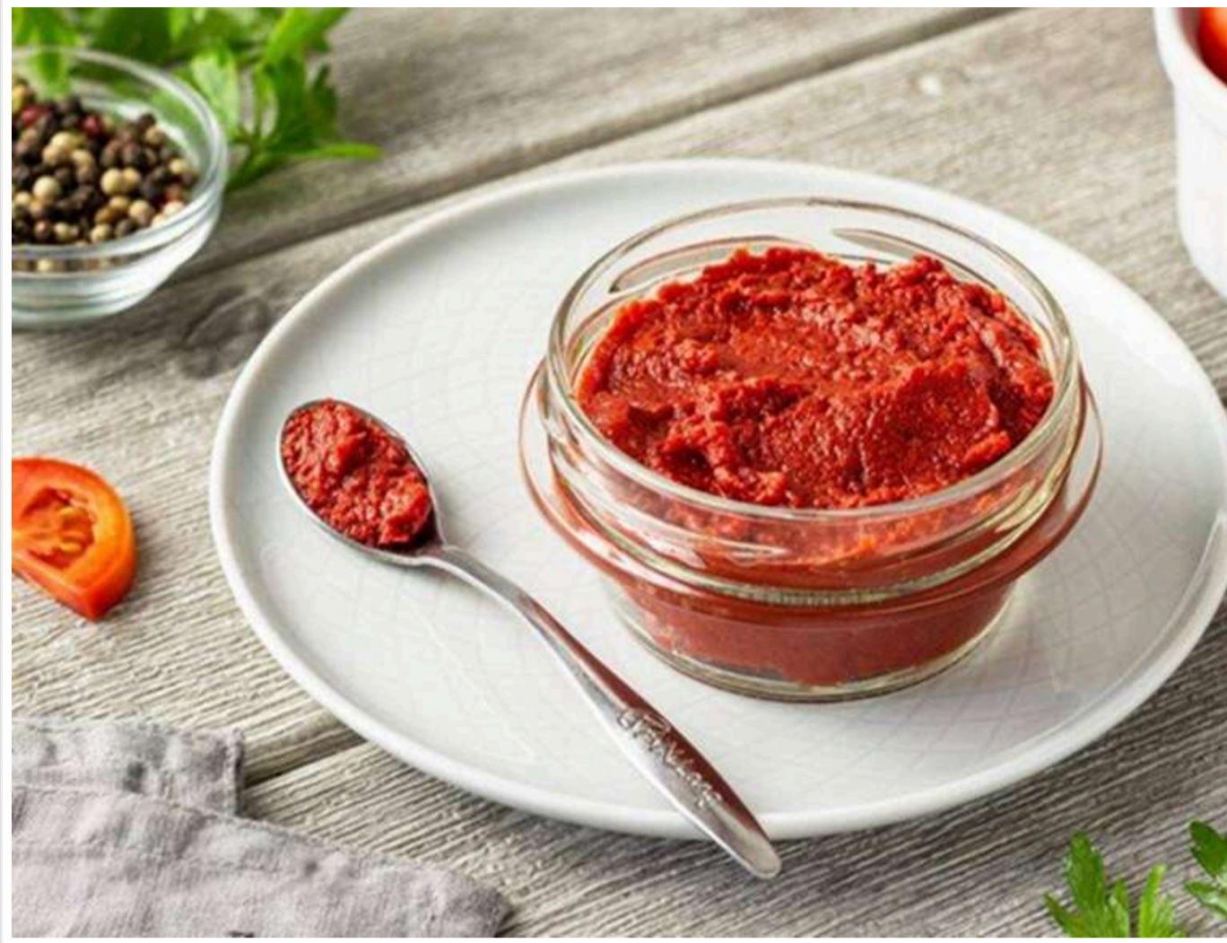
Одеська митниця програла апеляцію у справі про конфіскацію партії томатної пасти на мільйон гривень